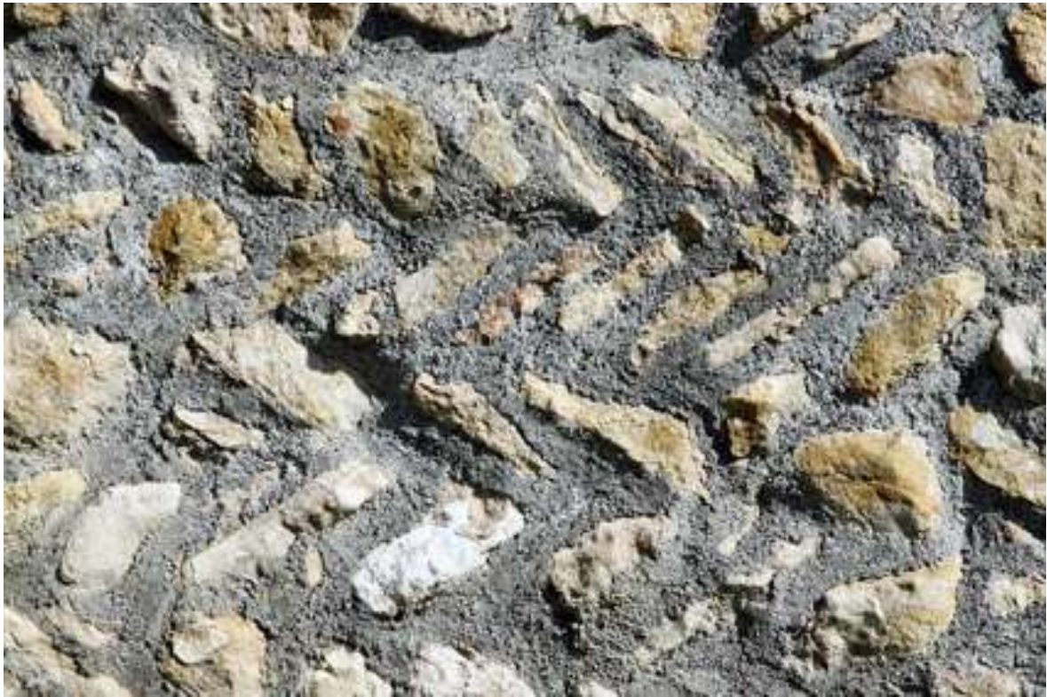
Fischgrätmuster in der Kirchhofsmauer