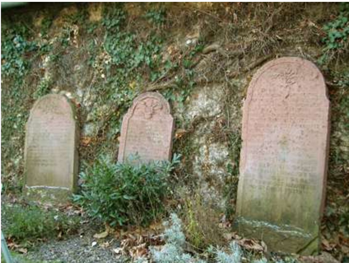
Die „Weber“- Steine